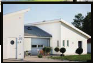
Enplans nyfunkishus är mycket populära